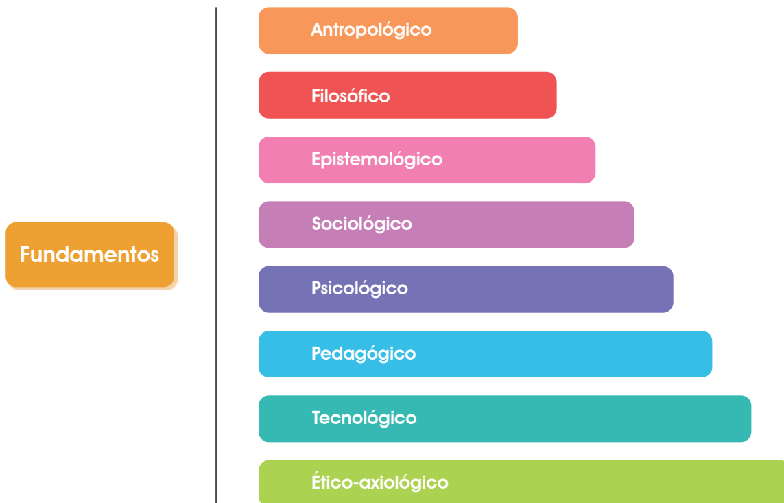
Gráfica 2. Fundamentos del Currículo en la UDI