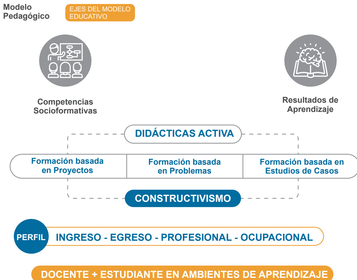
Gráfica 3. Modelo Pedagógico UDI