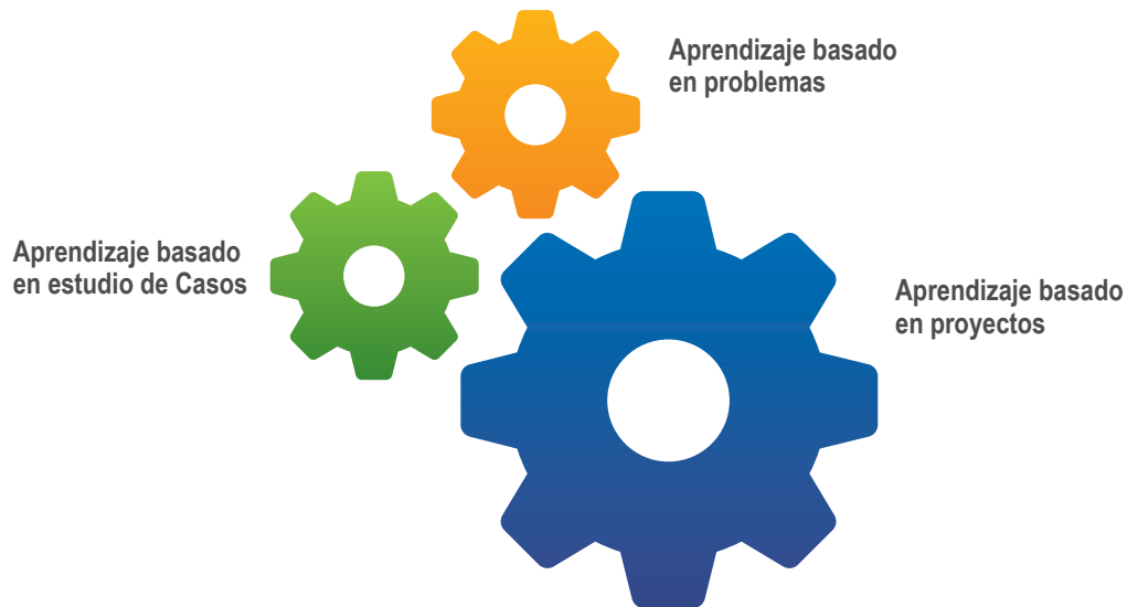
Gráfica 4. Didácticas Activas en la UDI